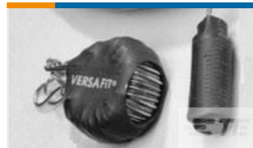
TE 产品编号938365P003 VERSAFIT-1/8-0-0.6IN-ST