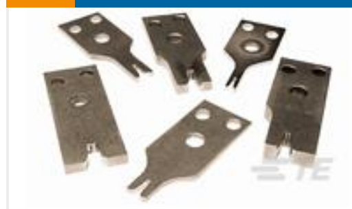
TE 产品编号6-456408-4 CRIMPER, WIRE .110 F PREMIUM