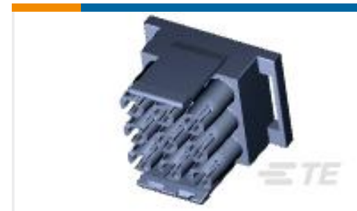
TE 产品编号2029370-1 09P UMNL-II REAR, TW-N-LK-CAP