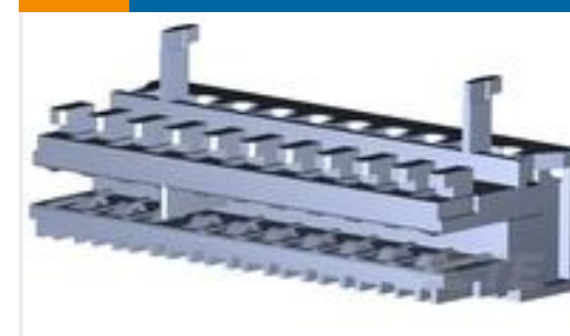
TE 产品编号7-1534796-0 AMP DUOPLUG MK2 CONNECTOR 10P