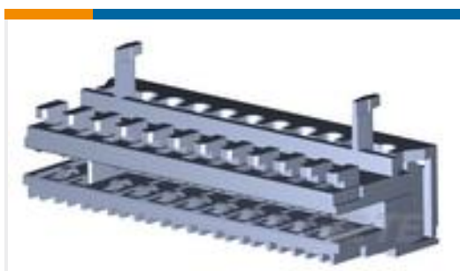
TE 产品编号4-1534797-1 AMP DUOPLUG MK2 CONNECTOR 11P