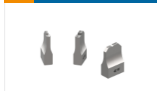
ANVIL REPRESENTATION ONLY