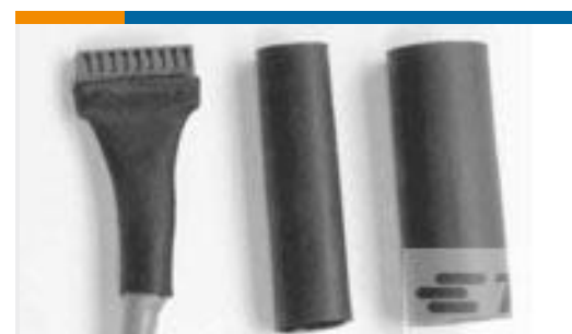
TE 产品编号2951516014 DWP-125-1/4-0-1IN