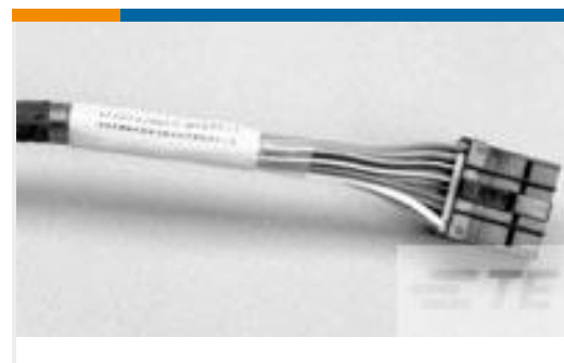
TE 产品编号 3137796007 RT-375-1-X-30MM