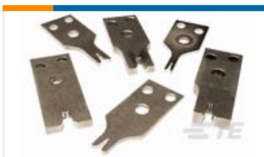
TE 产品编号 2-1633471-4 CRIMPER, INSULATION F (.185")