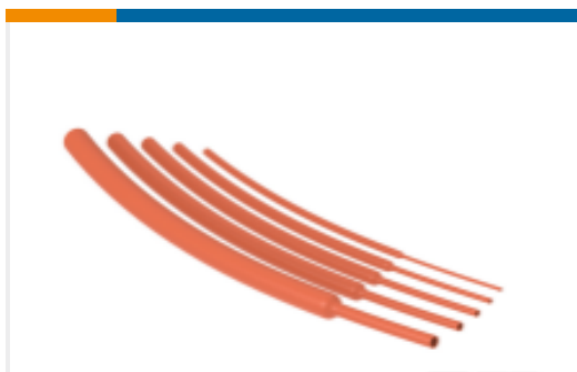
TE 产品编号 NB13664001 RNF-100-3/8-OR-SP