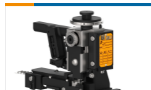
TE 产品编号 2837838-1 OCEAN-2.0-APPLICATOR-S-100F1300