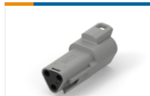
TE 产品编号 2-2600026-2 3CCT GREY RECEP W/SMALL SEAL