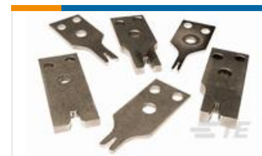
TE 产品编号 3-456407-4 CRIMPER, WIRE .100 "F"