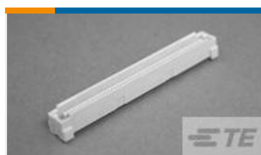
TE 产品编号5084615-1 0.8FH,P06H.5,040,30/Sn,TU