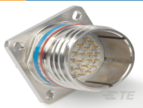
TE 产品编号YDTS20Z13-98PNV001 RECP ASSY