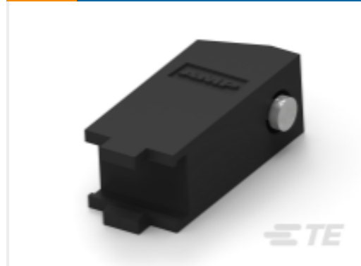
TE 产品编号5205729-3 CABLE CLAMP ASSY,BULK PACKED