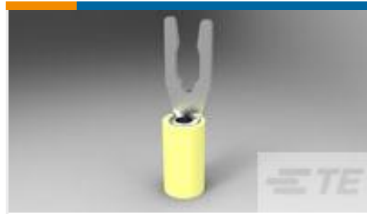
TE 产品编号52430-3 TERMINAL, PIDG SPR SPD 12-10 6