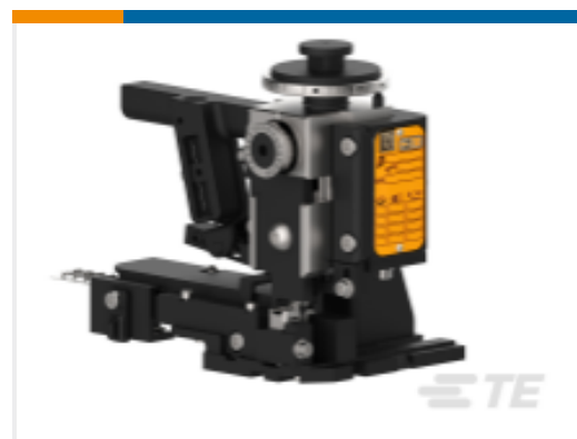
TE 产品编号2836188-1 OC-AT-S-FM-061F087O-030-0768