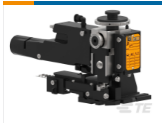
TE 产品编号2836163-2 OCEAN_2.0_Applicator-S-049F066O-RSA