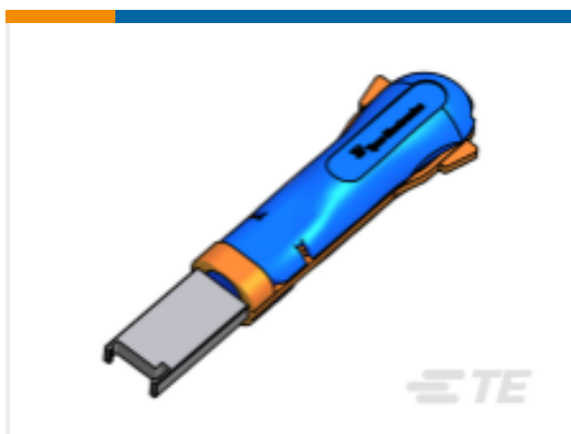
TE 产品编号6-1579018-7 EXTRACTION TOOL