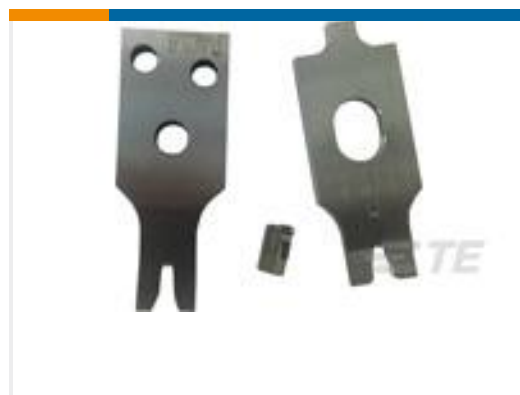
TE 产品编号7-2266295-7 OC-055F100F-CRIMPTOOLINGKIT