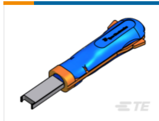
TE 产品编号6-1579018-6 EXTRACTION TOOL