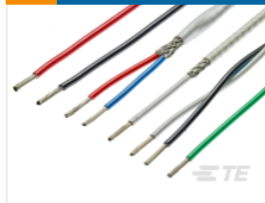
TE 产品编号2824623001 44A0211-22-8