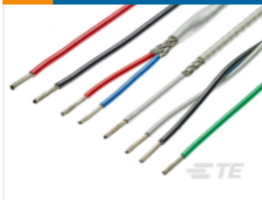
TE 产品编号2197853001 99M0211-12-8