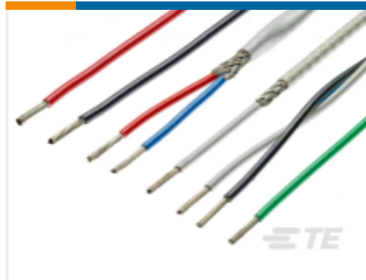
TE 产品编号2825913001 44A0211-20-4