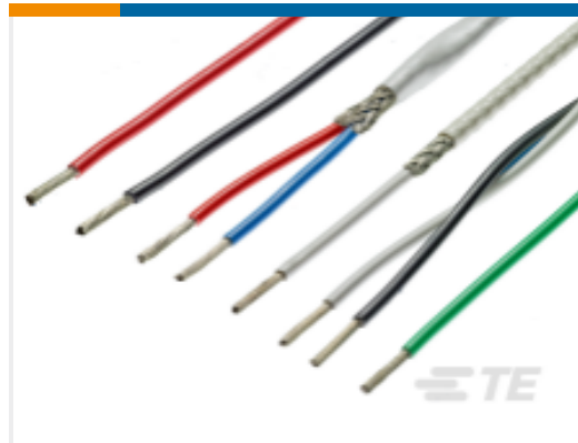
TE 产品编号6039853001 99M0111-16-20