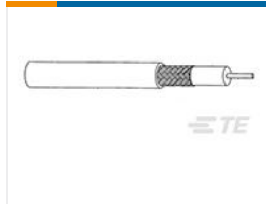
TE 产品编号3782133001 5024A1811-0