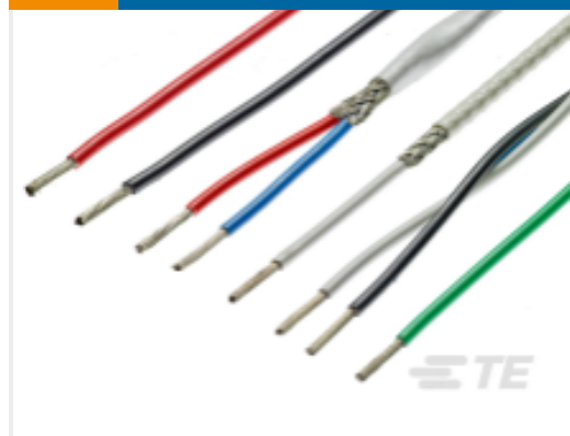
TE 产品编号7318373001 99M0211-16-9