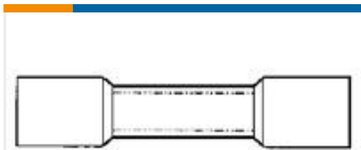
TE 产品编号55845-1 #8 PRE-INSUL SEALED SPLICE