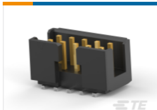
TE 产品编号1-2373376-0 10P,2MM,SHRD HDR,DRV,T,SMD,0.1 AU,TB