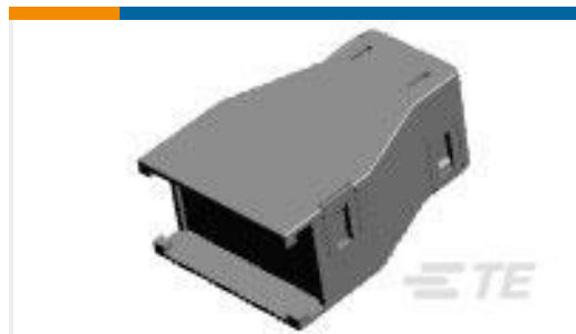
TE 产品编号1986185-1 Strain Relief,6 Posn,D5200 Dynamic. 2