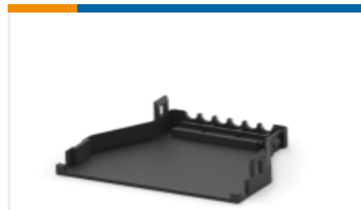
TE 产品编号1776695-1 Strain Relief, D5200, Dynamic AU,TB