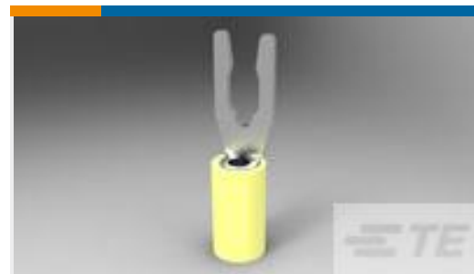
TE 产品编号52430-3 TERMINAL,PIDG SPR SPD 12-10 6