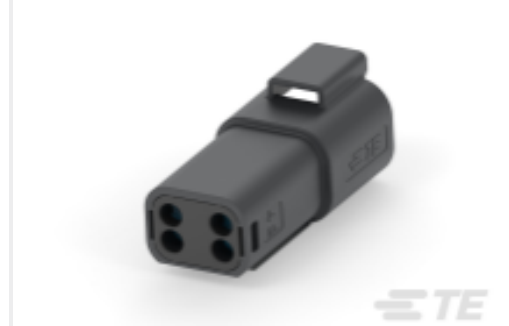
TE 产品编号1-2600030-0 4CCT BLACK RECFP W/LARGE SEAL