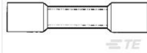
TE 产品编号55845-1 #8 PRE-INSUL SEALED SPLICE