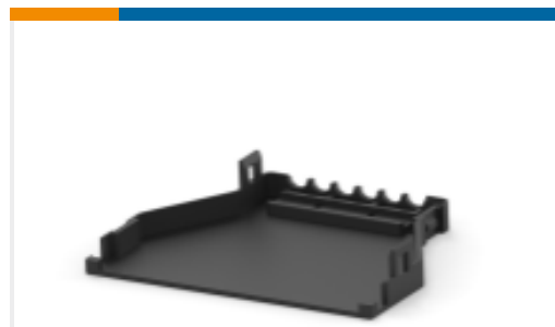
TE 产品编号1776695-1 Strain Relief, D5200, Dynamic