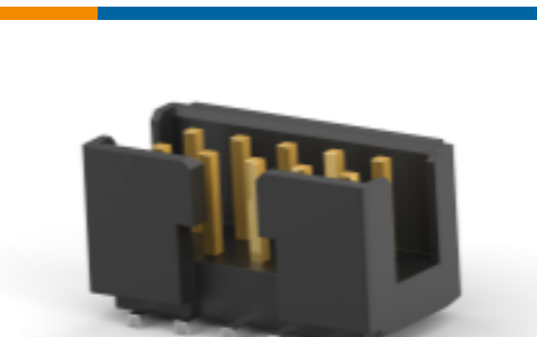
TE 产品编号1-2373376-0 10P,2MM,SHRD HDR,DRVT,SMD,0.1 AU,TB