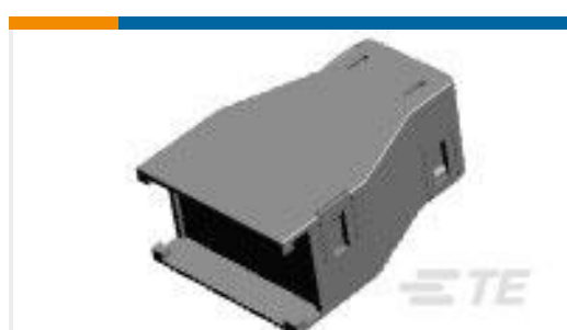
TE 产品编号1986185-1 Strain Relief,6 Posn,D5200 Dynamic. 2