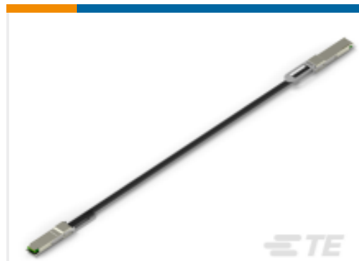
TE 产品编号2333393-7 QSFP 25GIG 30AWG 3 METER