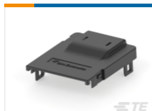
TE 产品编号1986186-1 Strain Relief,20 Posn,D3000 Dynamic, 2