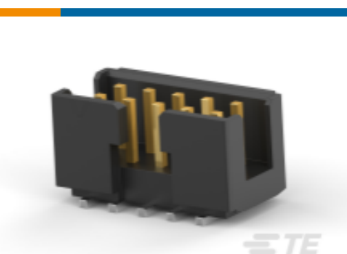
TE 产品编号1-2373376-0 10P,2MM,SHRD HDR,DRV,T,SMD,0.1 AU,TB