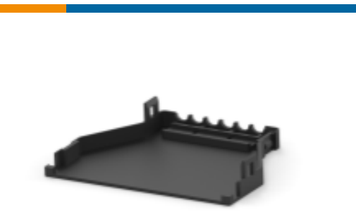
TE 产品编号1776695-1 Strain Relief, D5200, Dynamic