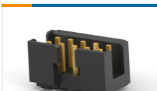
TE 产品编号1-2373376-0 10P,2MM,SHRD HDR,DRVVT,SMD,0.1 AU,TB