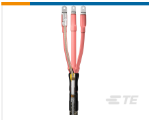
TE 产品编号A31452-070 GUST-12/70-120/800-L12