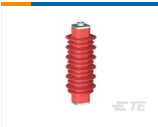
TE 产品编号EN6028-000 HDA-33M-B3-NFF