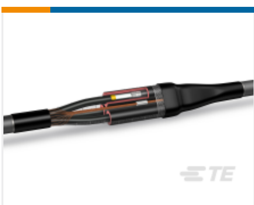
TE 产品编号D11309-070 POLJ-12/3X25-70