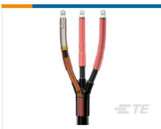
TE 产品编号E92435-063 POLT-12D/3XIH1