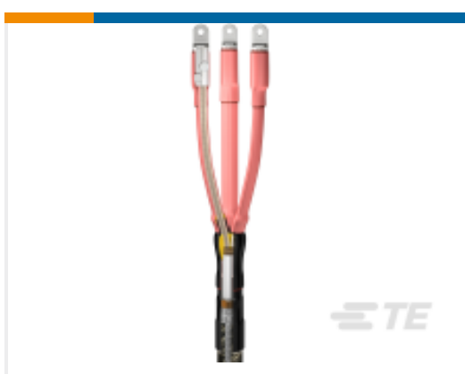
TE 产品编号C47372-064 GUST-12/25-50/800