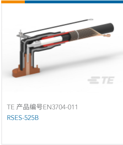
TE 产品编号EN3704-011 RSES-525B