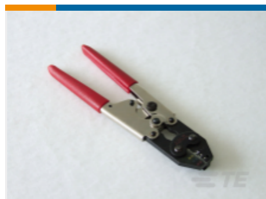
TE 产品编号 992008-000 AD-1377-CRIMP-TOOL-3-CVTY