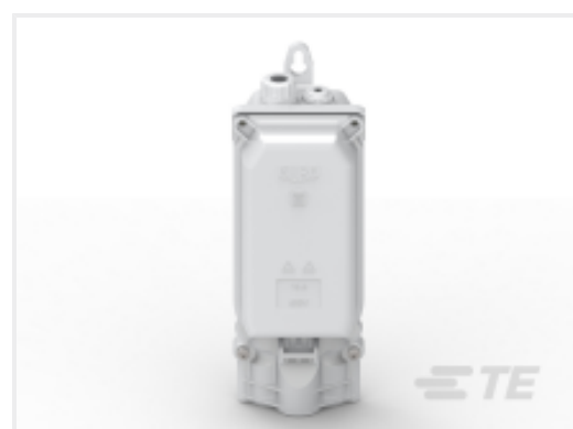
TE 产品编号619568-000 EKM-1281-1D2-5X16-2PG-C3