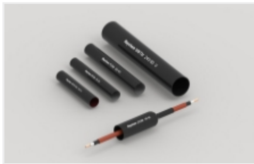
电源电缆管路和附件(317)