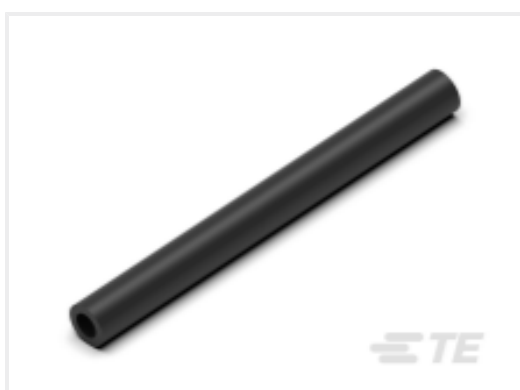
TE 产品编号D21910-000 EN-DCPT-3/1.5-45-SP