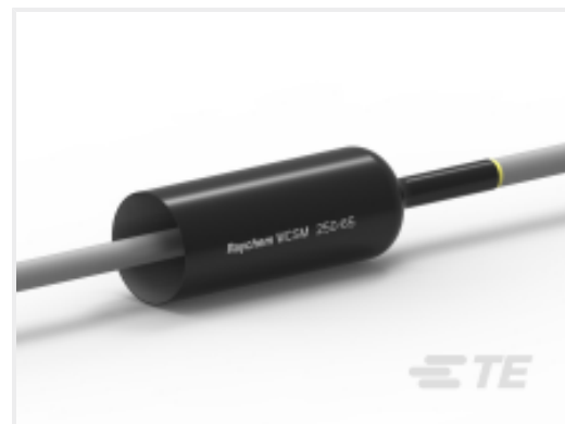
TE 产品编号CL1090-000 WCSM-250/65-1000/S(S5)