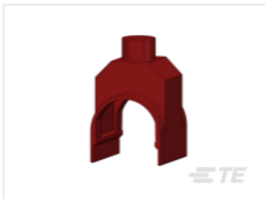
TE 产品编号CF9621-000 HEL-4836 SK(C500)