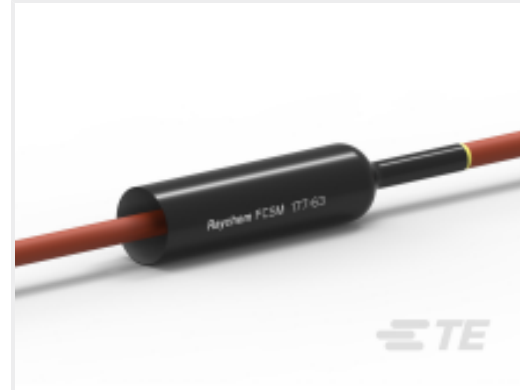
TE 产品编号 E71033-000 FCSM-177/63-1000/S(S5)