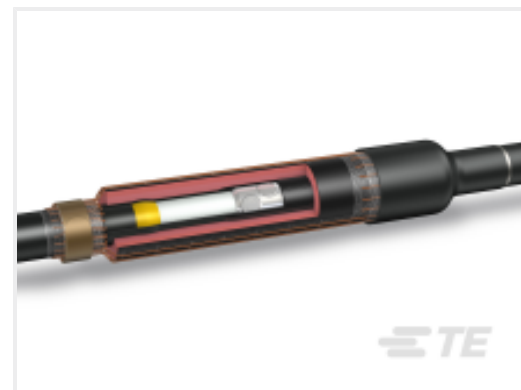
TE 产品编号F12535-014 POLJ-12/1X120-240