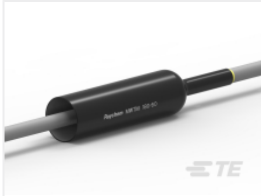
TE 产品编号 693332-000 MWTM-180/60-500/S(S5)