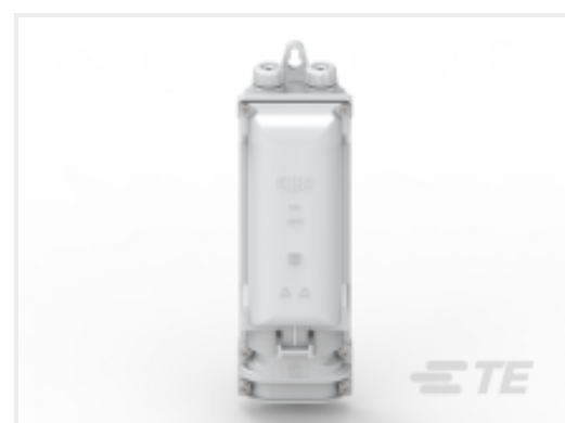
TE 产品编号592520-000 EKM-1282-4D1-5S-2PG-C2