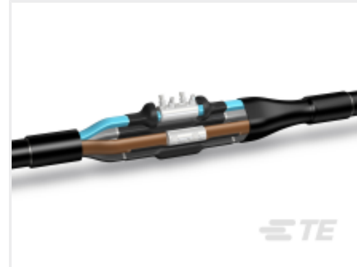
TE 产品编号 CY1501-000 LJSM-4X095-240