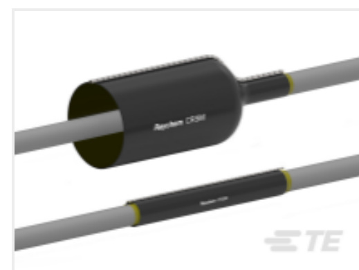
TE 产品编号CAT-CRSM 用于电缆维修的拉链套管