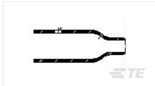
TE 产品编号813681-000 208A086-3-0