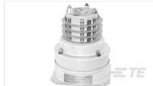
TE 产品编号1-1393139-9 MDR-170-2=MDR