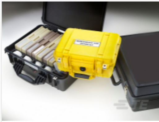
TE 产品编号A12306-000 MK-0020-105-DATABUS