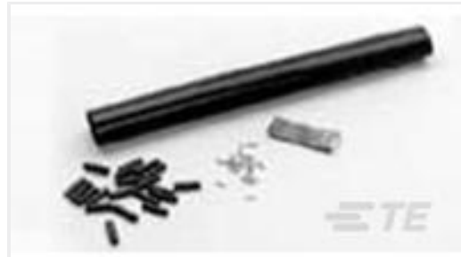
TE 产品编号426913-000 LNCL-13-305-GK