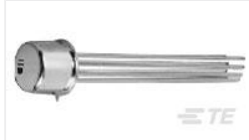
TE 产品编号1-1617351-0 JMACDG-18XP=M39016/15-092P