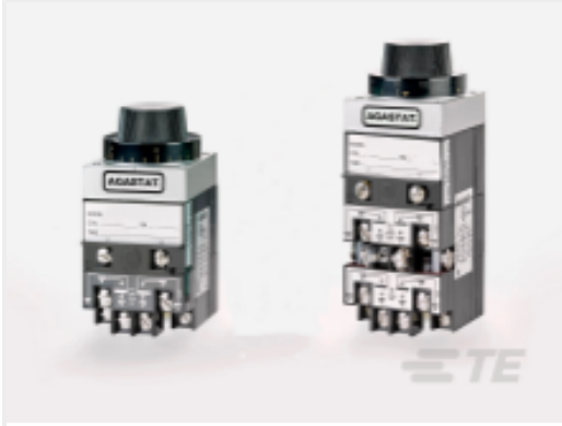
TE 产品编号1423183-7 7032CDD=RLY,STD,DBH,2P,480VAC