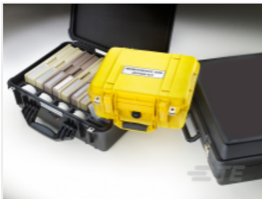
TE 产品编号312053-000 HRM/01-2117