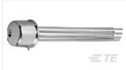
TE 产品编号1617165-1 JMAWDD-12XP = M39016/20-010P