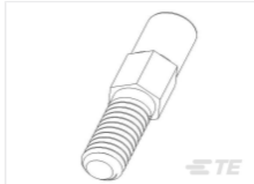
TE 产品编号65022-003 JUNCTION ASSY