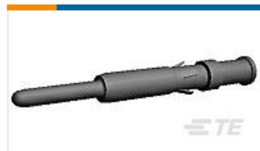
TE 产品编号796964-1 PIN ASSY,18-16 AWG,HI CURRENT