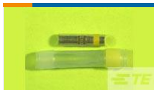
TE 产品编号650143-000 D-436-0133