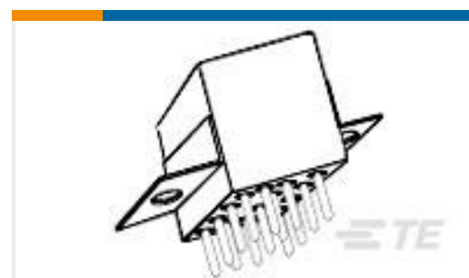
TE 产品编号1-1617754-7 FCA-410-1620M=M83536/16-020M