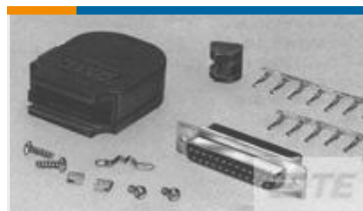
TE 产品编号749812-7 KIT,HDP-20,RCPT, SIZE 1, 9 POS