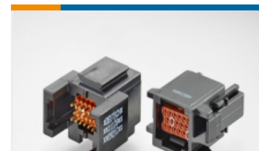
TE 产品编号ABC03N-16S-4048 IN-LINE RECP