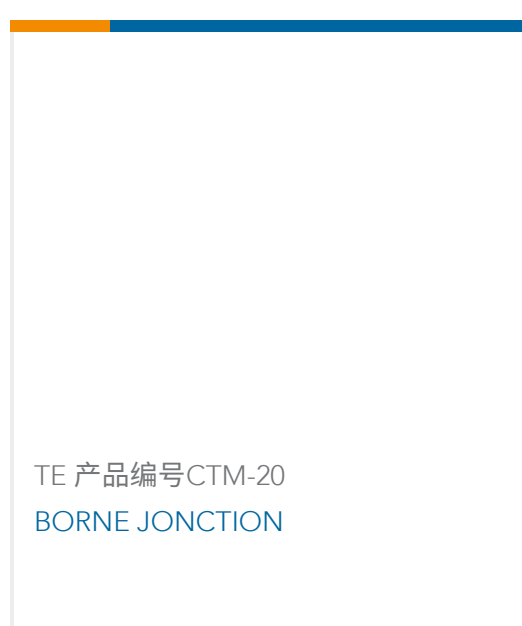
TE 产品编号CTM-20 BORNE JUNCTION