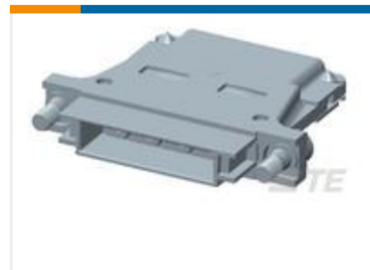
TE 产品编号981759-000 MTCC1P-COAX-01P-01