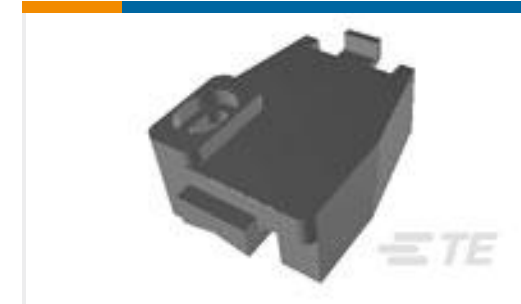
TE 产品编号640715-1 06P UMNL STR/REL