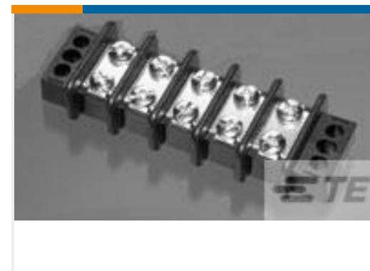
TE 产品编号1546311-3 3P .563" DR BARRIER,W/WASHER