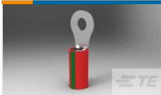
TE 产品编号51863-2 TERMINAL PIDG R IR 22 6