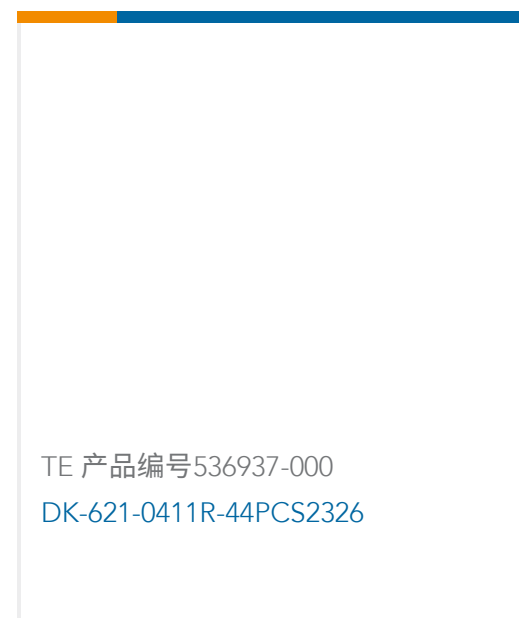
TE 产品编号536937-000 DK-621-0411R-44PCS2326