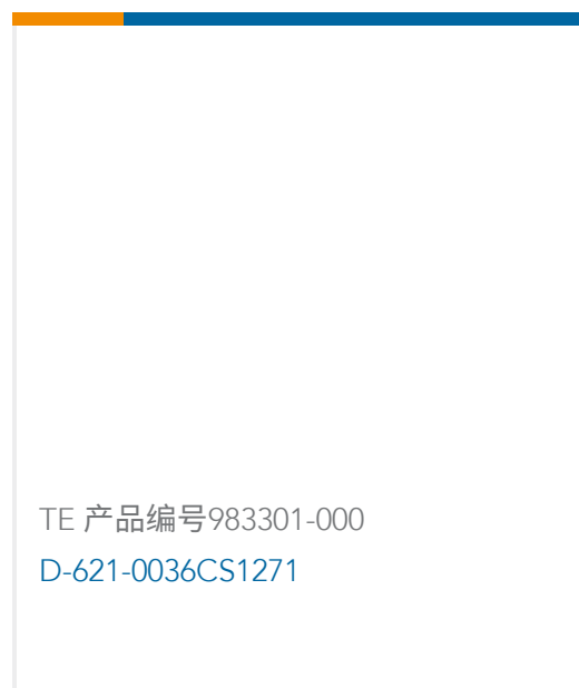
TE 产品编号983301-000 D-621-0036CS1271