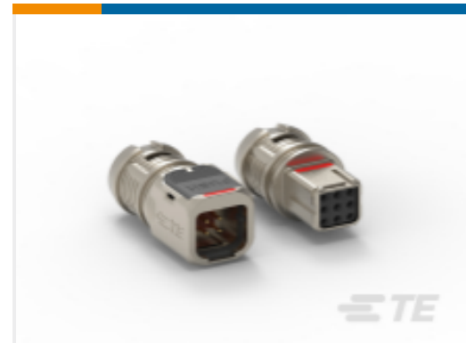
TE 产品编号YD369-MP99-AP10000 369 9 WAY SHIELDED PLUG, CRIMP, PIN