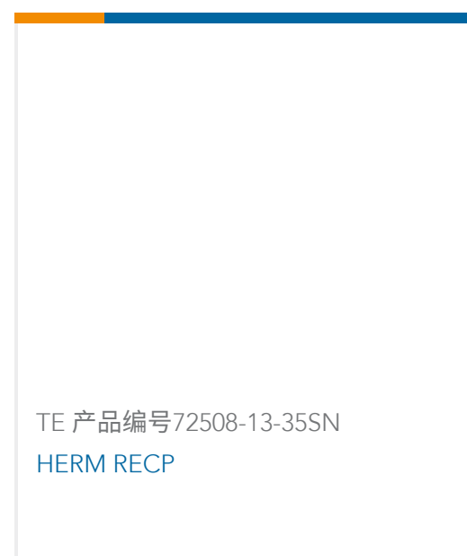
TE 产品编号72508-13-35SN HERM RECP