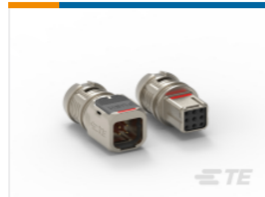
TE 产品编号YD369-MR33-AS10000 369 3 WAY SHIELDED REC, CRIMPT, SKT