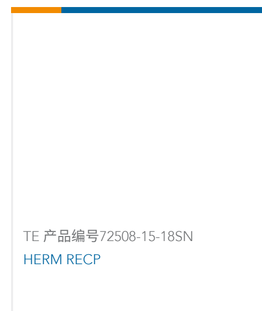
TE 产品编号72508-15-18SN HERM RECP