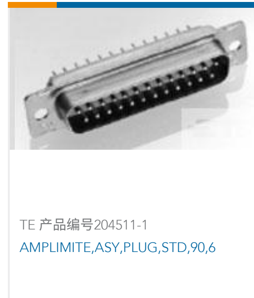
TE 产品编号204511-1 AMPLIMITE,ASY,PLUG,STD,90,6