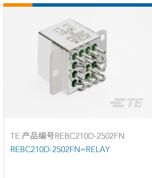
TE 产品编号REBC210D-2502FN REBC210D-2502FN=RELAY