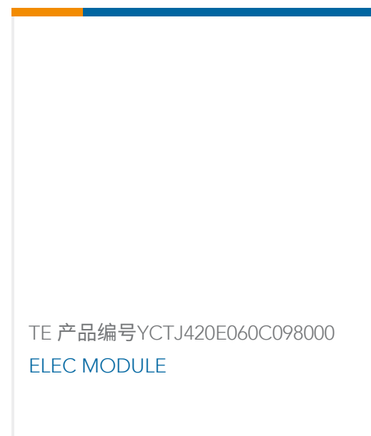
TE 产品编号YCTJ420E060C098000 ELEC MODULE