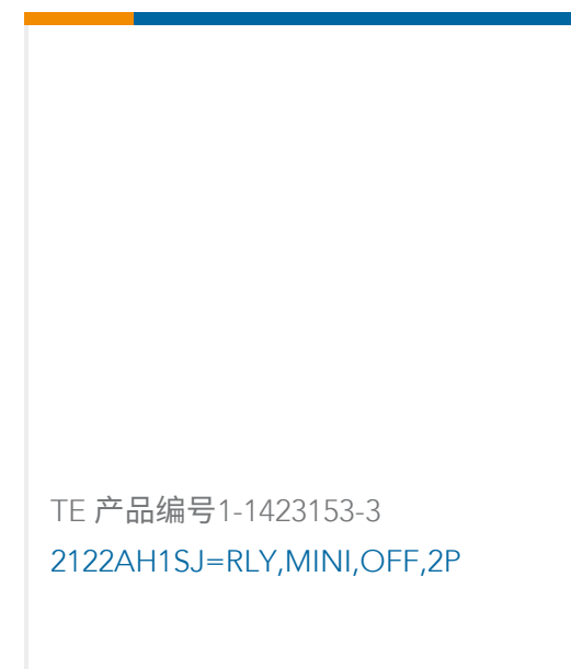
TE 产品编号1-1423153-3 2122AH1SJ=RLY,MINI,OFF,2P