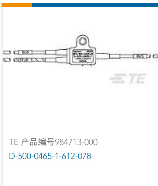
TE 产品编号984713-000 D-500-0465-1-612-078