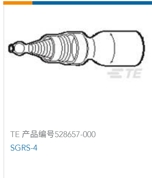
TE 产品编号528657-000 SGRS-4