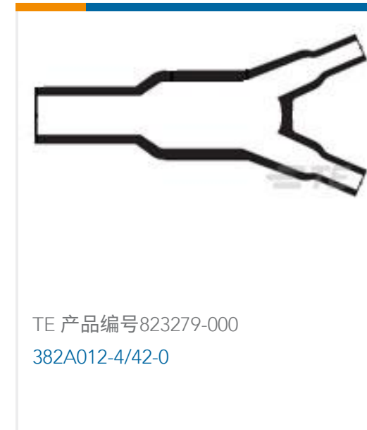
TE 产品编号823279-000 382A012-4/42-0