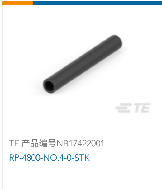
TE 产品编号NB17422001 RP-4800-NO.4-0-STK