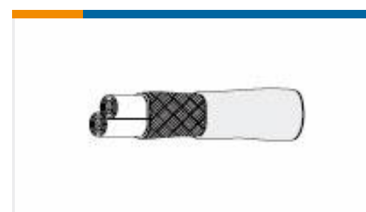
TE 产品编号895313-000 55A1822-22-9/96-9CS2275