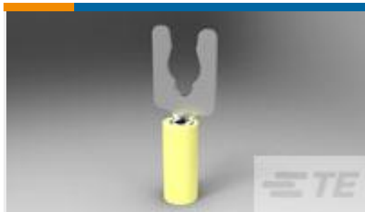
TE 产品编号52941-1 TERMINAL,PIDG SPR SPD 12-10 6