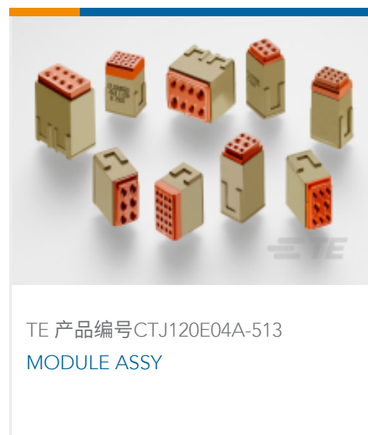
TE 产品编号CTJ120E04A-513 MODULE ASSY