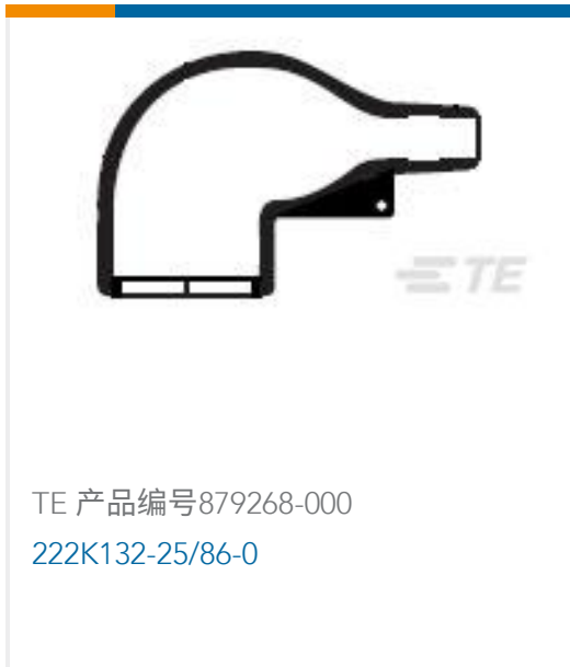
TE 产品编号879268-000 222K132-25/86-0