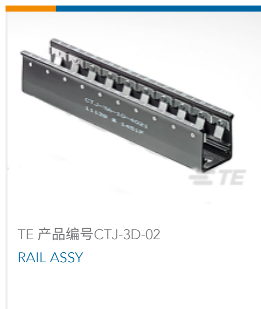
TE 产品编号CTJ-3D-02 RAIL ASSY