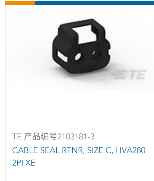
TE 产品编号2103181-3 CABLE SEAL RTNR, SIZE C, HVA280-2PI XE