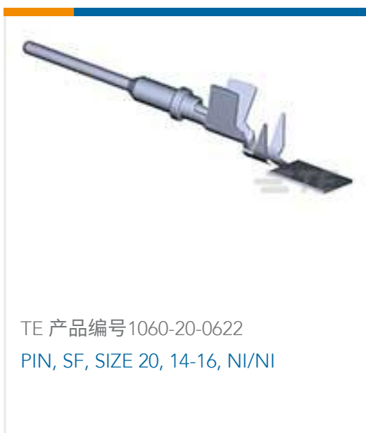
TE 产品编号1060-20-0622 PIN, SF, SIZE 20, 14-16, NI/NI