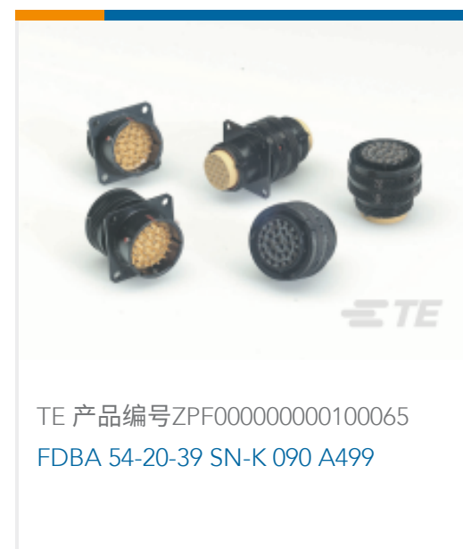
TE 产品编号ZPF00000000100065 FDBA 54-20-39 SN-K 090 A499