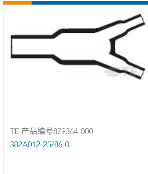
TE 产品编号879364-000 382A012-25/86-0