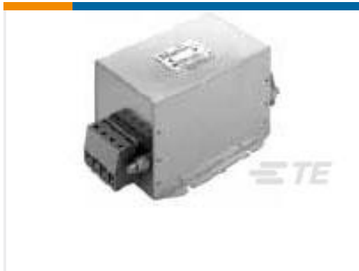
TE 产品编号6609067-6 150AYC10B=F7809