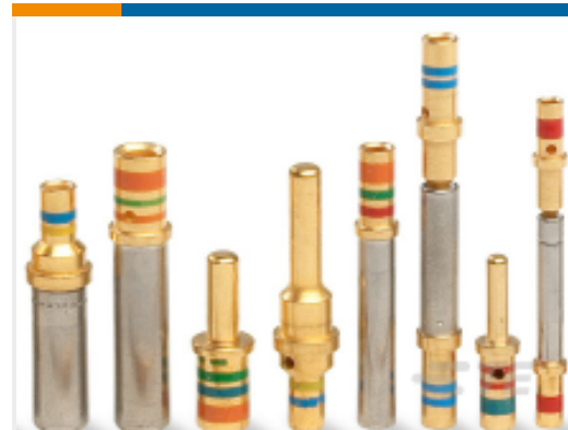
TE 产品编号12333-16 CONT SOC ASSY