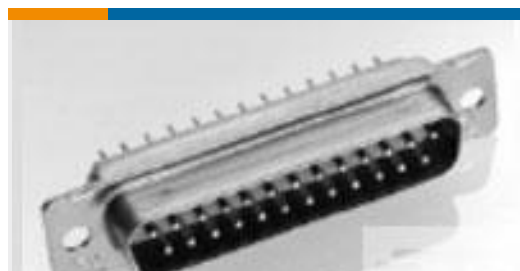
TE 产品编号205170-1 AMPLIMITE,ASY,PLUG,STD,109,5