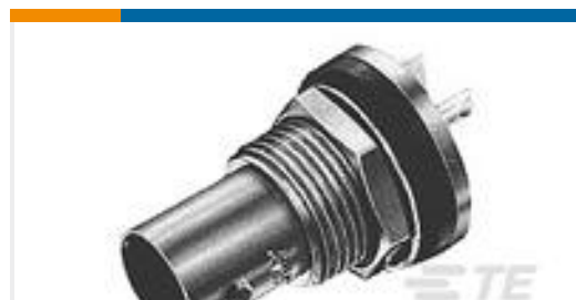
TE 产品编号227426-1 BNC BLKHD RECPT SEALED