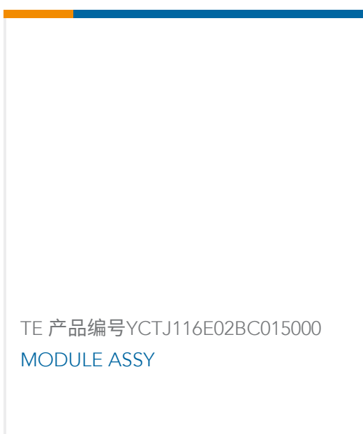
TE 产品编号YCTJ116E02BC015000 MODULE ASSY