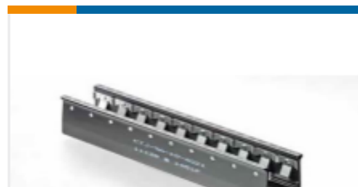
TE 产品编号CTJ-3A-02 RAIL ASSY