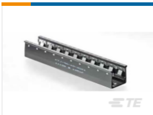
TE 产品编号CTJ-3A-06-4021 RAIL ASSY