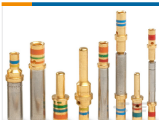
TE 产品编号0641-3-1231L CONT PIN