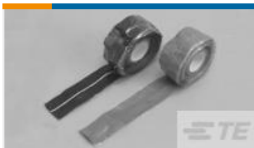
TE 产品编号608036-4 SILICONE FUSION TAPE, 1"X36'