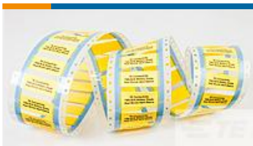
TE 产品编号6641710001 TMS-SCE-1/4-2.0-9