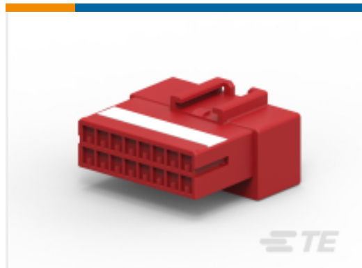
TE 产品编号2-936211-6 090III 16P CAP ASSY RED