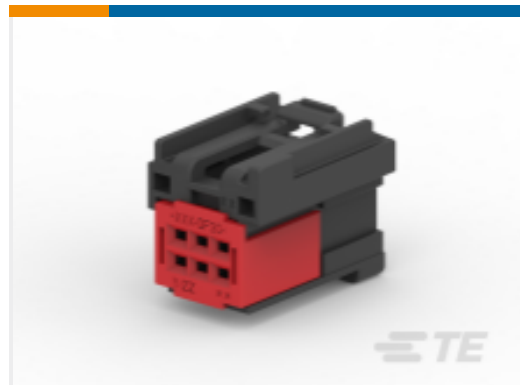
TE 产品编号9-1411325-4 2X3POS. GET-ASSY SOCKET HOUSING