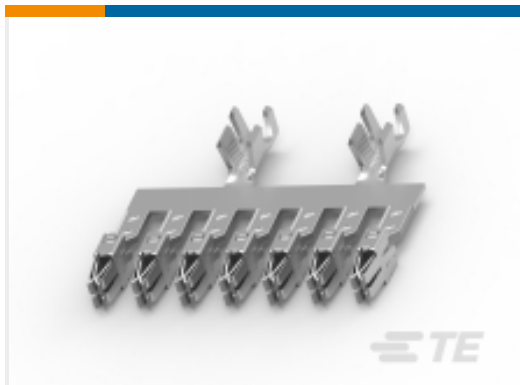
TE 产品编号1989037-5 BUSBAR, STD. POWER TIMER, 7P WELDED