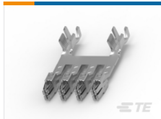
TE 产品编号1989037-3 BUSBAR, STD. POWER TIMER, 4 POSN.WELDED