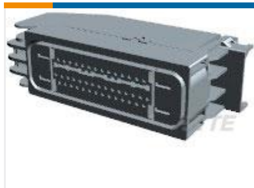
TE 产品编号9-1355512-7 47 WAY ABS CONNECTOR