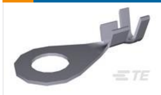
TE 产品编号880627-3 RING TONGUE