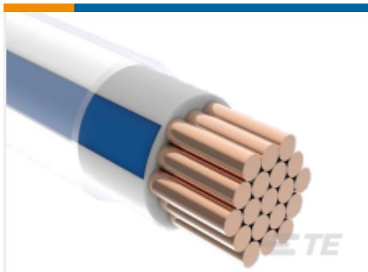
TE 产品编号CT73213001 ACW0219-1.00-68(NS)