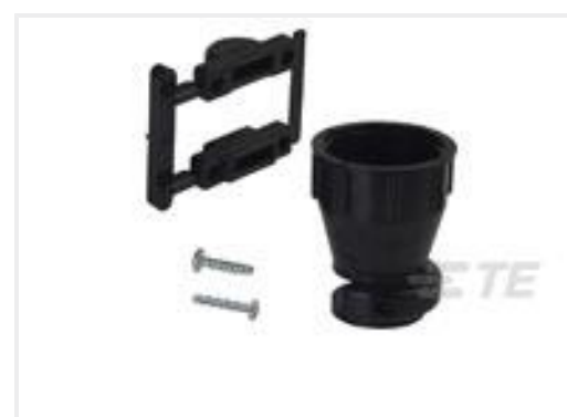
TE 产品编号206070-8 CABLE CLAMP KIT #17