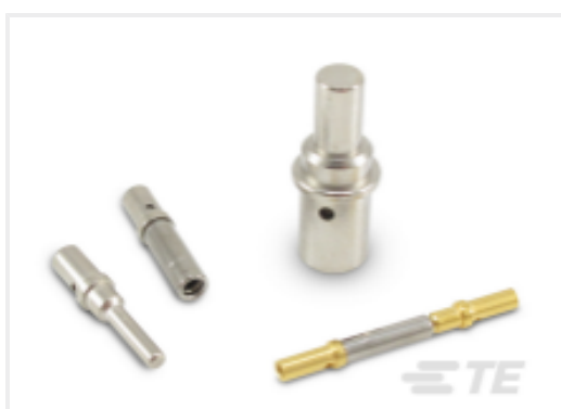
TE 产品编号CAT-D48-ST273 DEUTSCH Solid Contacts