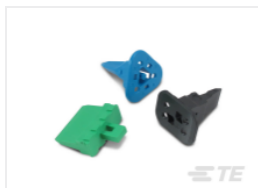
TE 产品编号CAT-D487-W416 Wedgelocks: DEUTSCH DT