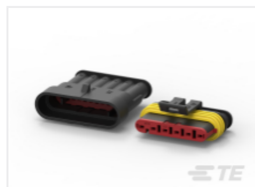
TE 产品编号CAT-AM71-CH8172 AMP SUPERSEAL 1.5MM 连接器壳体