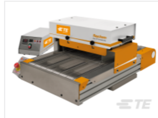
TE 产品编号 2326489-1 MODEL 105 TUNNEL OVEN, 36" ENTRY, STANDAR