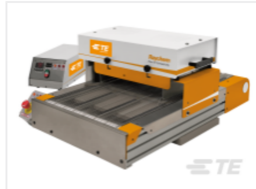
TE 产品编号 2394980-1 MOD 105 TUN OVEN, 69" ENTRY, STANDARD