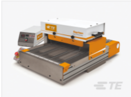
TE 产品编号 955018-000 CLTEQ-M105-TUNNEL-OVEN