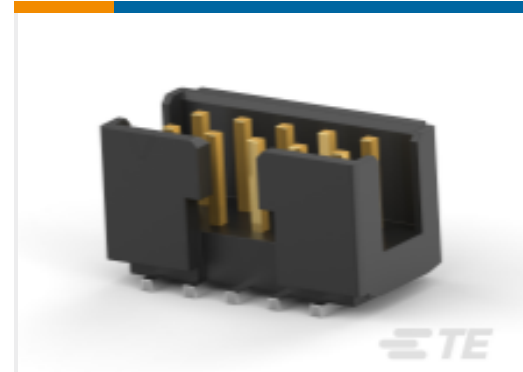
TE 产品编号1-2373376-0 10P,2MM,SHRD HDR,DRVT,SMD,0.1 AU,TB