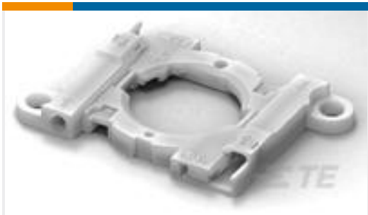
TE 产品编号2174024-1 LUMAWISE LED HOLDER, TYPE NL2