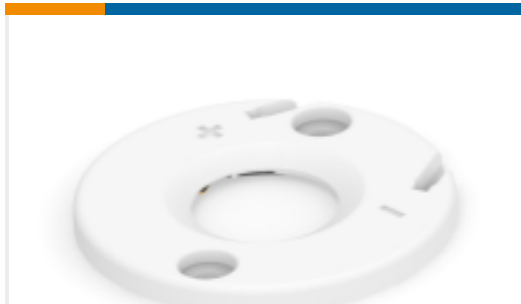
TE 产品编号2325807-2 LUMAWISE Z45 LED HOLDER 19X19