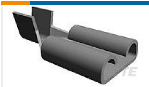
TE 产品编号62850-1 110 FASTON REC 20-18 AWG TPBR