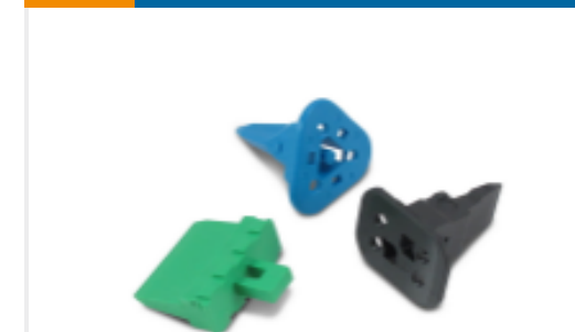
TE 产品编号W2S Wedgelocks: DEUTSCH DT