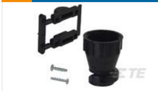
TE 产品编号206070-8 CABLE CLAMP KIT #17