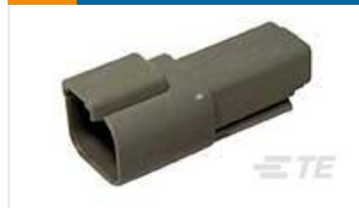
TE 产品编号DT04-2P REC, 2P, GRY, N