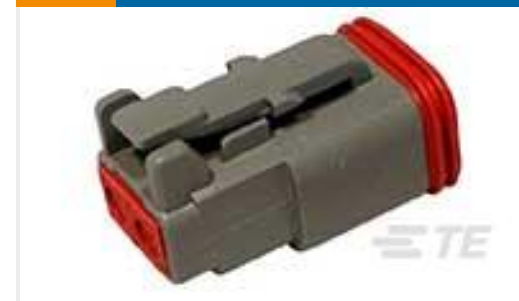
TE 产品编号DT06-2S PLG, 2P, GRY, N