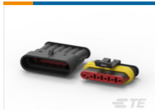
TE 产品编号282104-1 AMP SUPERSEAL 1.5MM, 连接器壳体