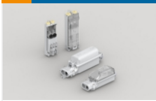
街道照明保险丝盒(200)