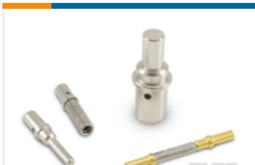
TE 产品编号0460-202-16141 DEUTSCH Solid Contacts