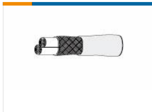
TE 产品编号272103-000 55A1123-20-9/96-9CS2275