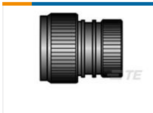
TE 产品编号527781-000 HEX40-AC-00-15-A5-1