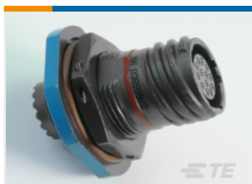
TE 产品编号YDTS24T15-97PAV001 RECP ASSY