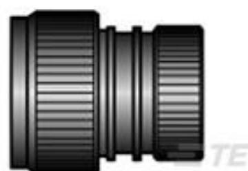
TE 产品编号527781-000 HEX40-AC-00-15-A5-1