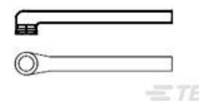
TE 产品编号CZ1868-000 222D211-25-70/225-0