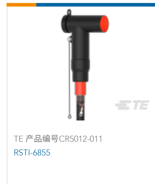
TE 产品编号CR5012-011 RSTI-6855