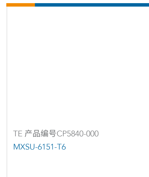
TE 产品编号CP5840-000 MXSU-6151-T6