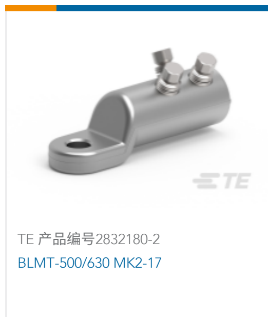
TE 产品编号2832180-2 BLMT-500/630 MK2-17