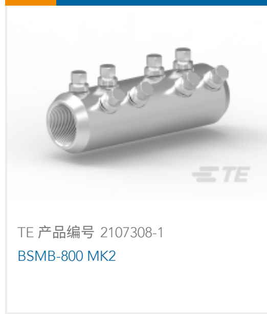
TE 产品编号 2107308-1 BSMB-800 MK2