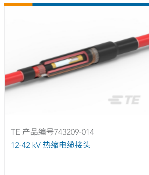
TE 产品编号743209-014 12-42 kV 热缩电缆接头