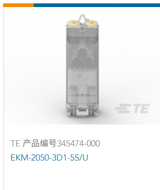
TE 产品编号345474-000 EKM-2050-3D1-5S/U