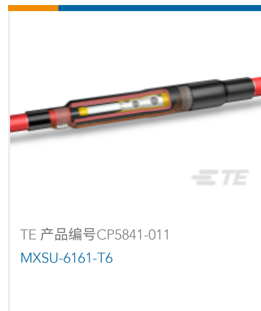
TE 产品编号CP5841-011 MXSU-6161-T6