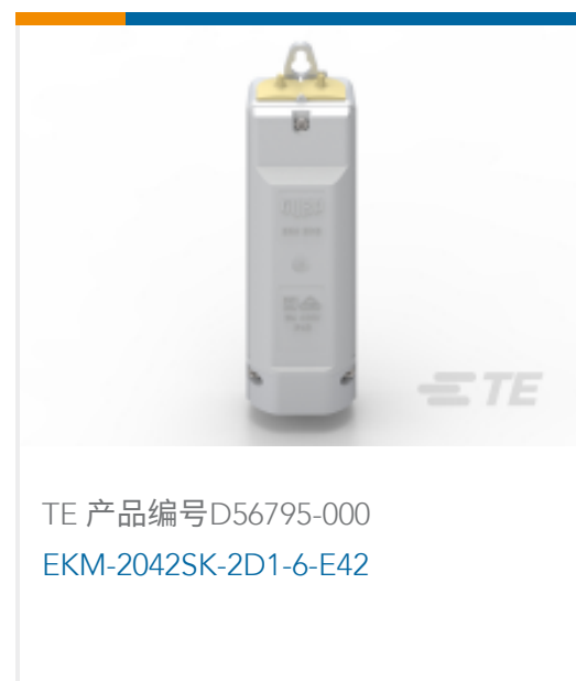
TE 产品编号D56795-000 EKM-2042SK-2D1-6-E42