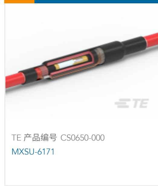
TE 产品编号 CS0650-000 MXSU-6171