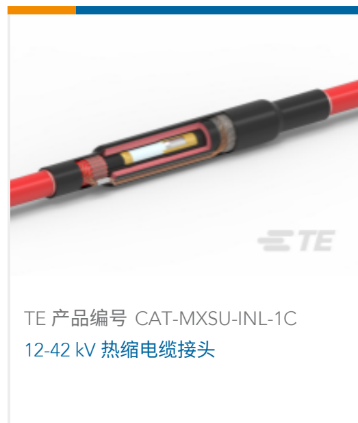
TE 产品编号 CAT-MXSU-INL-1C 12-42 kV 热缩电缆接头