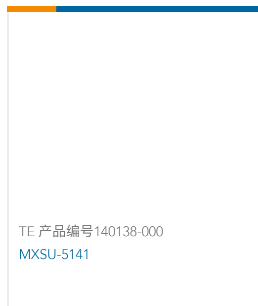
TE 产品编号 140138-000 MXSU-5141