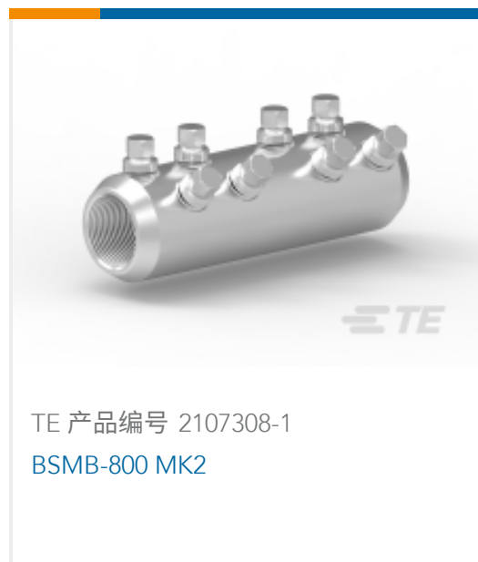
TE 产品编号 2107308-1 BSMB-800 MK2