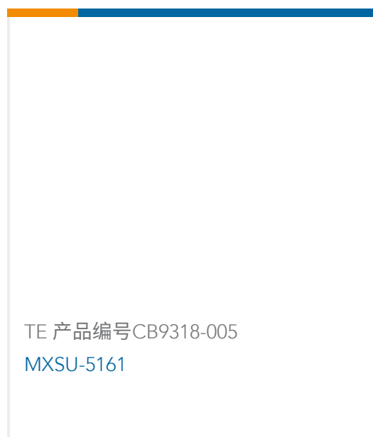
TE 产品编号 CB9318-005 MXSU-5161