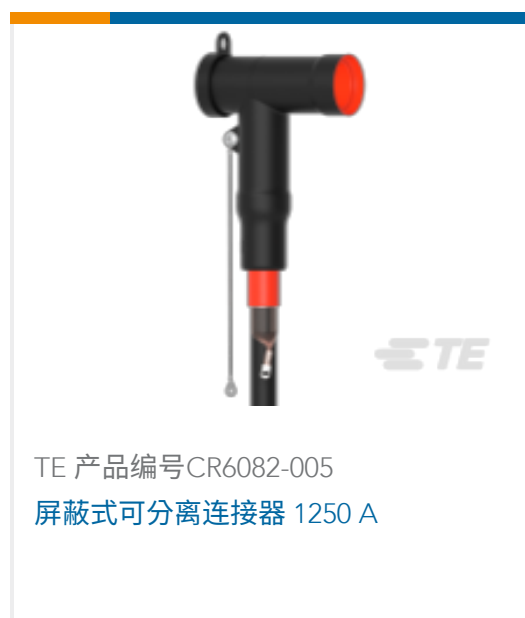
TE 产品编号 CR6082-005 屏蔽式可分离连接器 1250 A