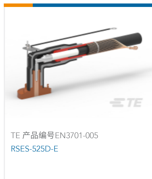
TE 产品编号 EN3701-005 RSES-525D-E