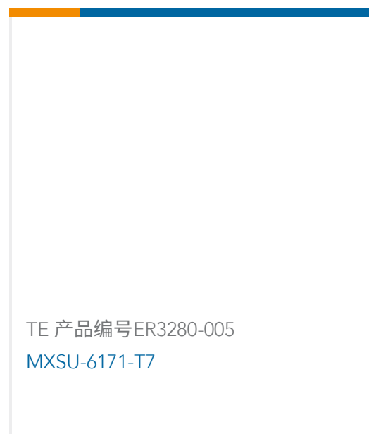
TE 产品编号 ER3280-005 MXSU-6171-T7