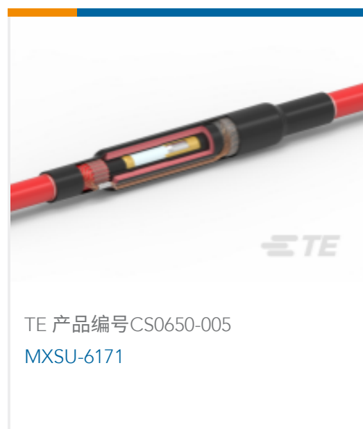
TE 产品编号 CS0650-005 MXSU-6171