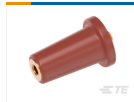
TE 产品编号 CS9958-000 RSTI-68TP