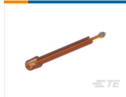
TE 产品编号 CN9356-011 RSTI-68TRL