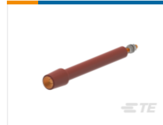
TE 产品编号 CN9357-011 RSTI-68TR