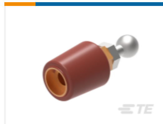
TE 产品编号 CS8405-011 RSTI-68EA25