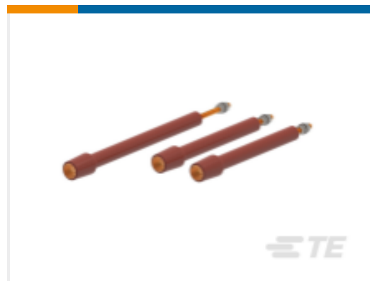
TE 产品编号 CN9358-011 RSTI-68TRA