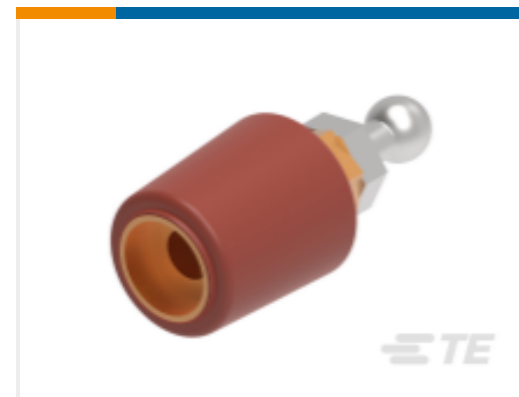
TE 产品编号 CS8406-011 RSTI-68EA20