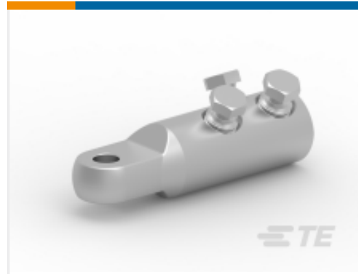
TE 产品编号 2107038-1 BLMC-185/400-16-1250A