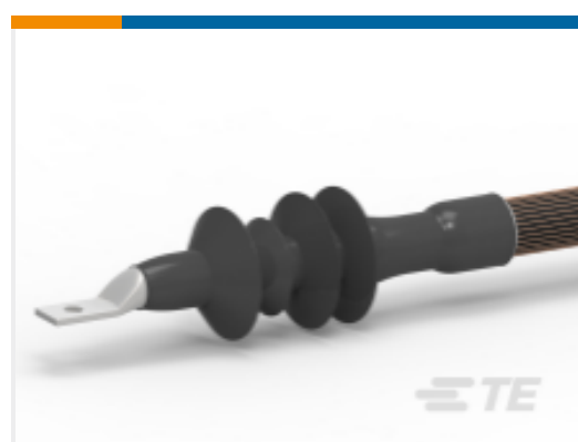
TE 产品编号EH7832-000 CSTO-283J