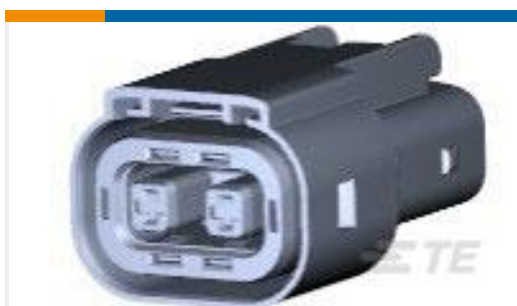
TE 产品编号1587902-6 Plug Pig Tail Assy, HV, HVA280 2P