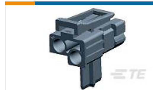
TE 产品编号1394778-2 1,5MM ST-GEH 2P