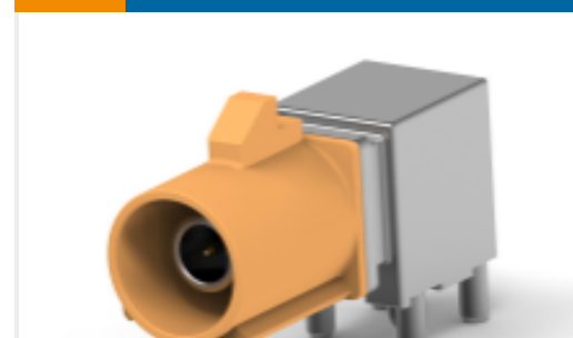
TE 产品编号1-2291392-2 MALE ASM, 1 POS, R/A, PCB, FAKRA