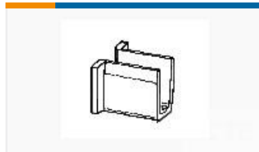
TE 产品编号40662 BUTT CONT 20-16 .020BR