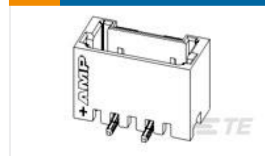
TE 产品编号292371-5 SINGLE ROW POST HEADER ASS'Y SMT TYPE W/