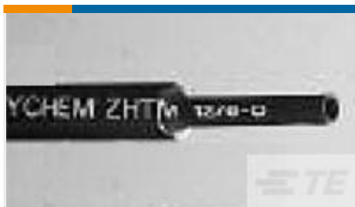
TE 产品编号2450984003 ZHTM-40/20-0-SP