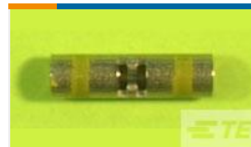
TE 产品编号680327-000 D-609-07