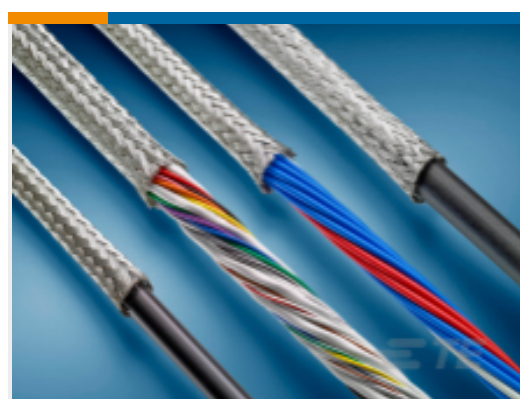
TE 产品编号CQ50543001 RAY-103-3.0(10)