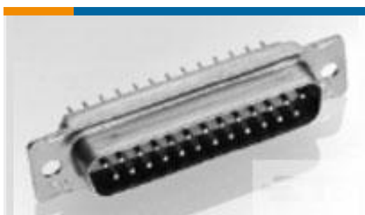
TE 产品编号1757824-3 AMPLIMITE,ASY,RCPT,STD,90,ZN,3