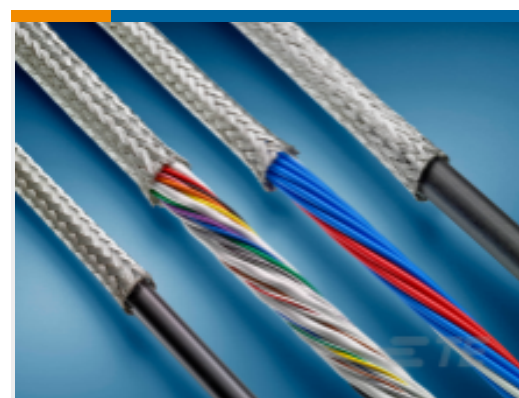
TE 产品编号CQ50513001 RAY-103-10.0(10)