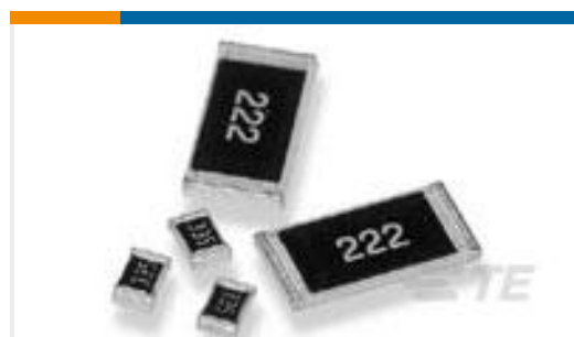
TE 产品编号1622829-1 CRG0603 1% 10K