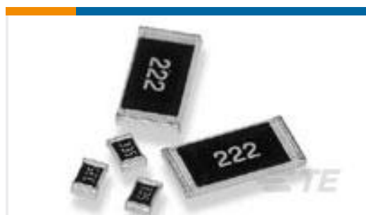
TE 产品编号1623141-1 CRG0805 1% 1M0