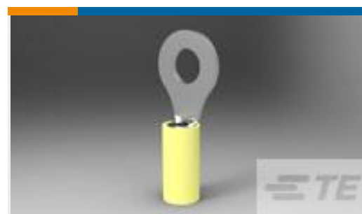
TE 产品编号130205 PIDG RING