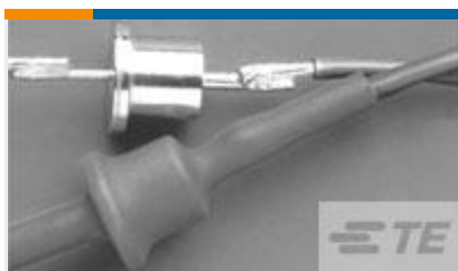
TE 产品编号5677842003 RNF-3000-3/1-9-STK