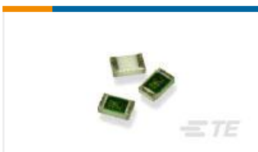
TE 产品编号1614917-1 CPF0805 2K2 0.1% 25PPM 5K RL