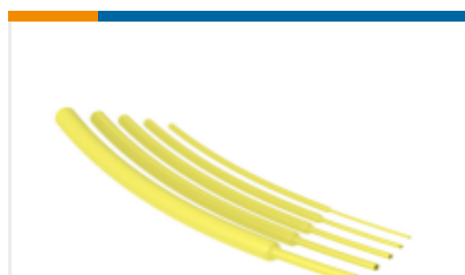
TE 产品编号EL95182001 VERSAFIT-3/16-4-STK