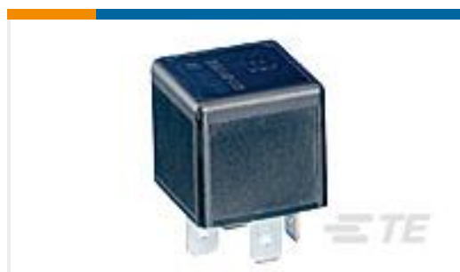
TE 产品编号3-1393303-7 V23134B1053C642-EV-CBOX