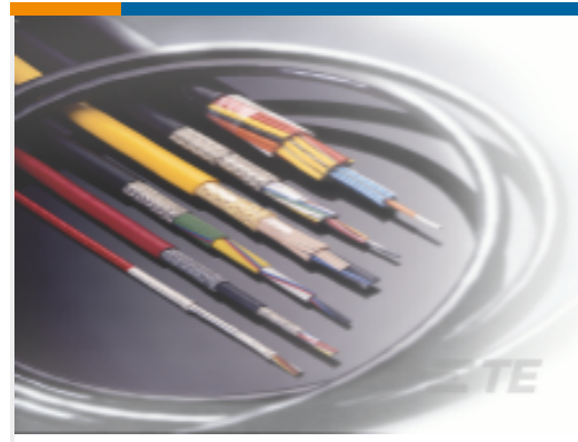
TE 产品编号CD51363001 100G1131-0.50-F974CK0226