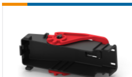
TE 产品编号2035037-1 WIRE DRESS ASSY, 96P LOW PROF