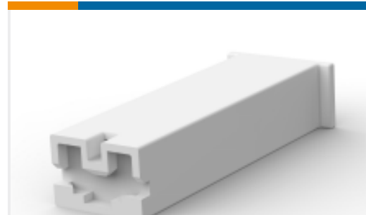
TE 产品编号928083-1 PL 187 REC HSG 1P NYLON NAT