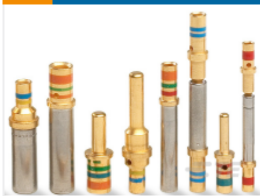
TE 产品编号4160-202-2031L CONT PIN