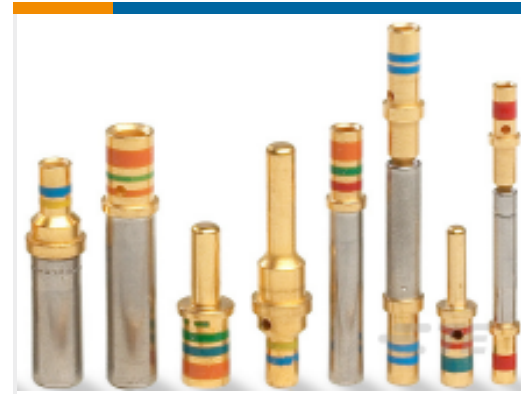
TE 产品编号0662-207-1631L CONT SOC ASSY