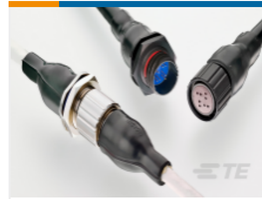
TE 产品编号2102353-5 CeeLok FAS-T, Plug Kit, Ni, B