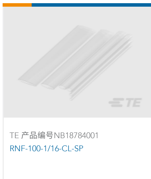
TE 产品编号NB18784001 RNF-100-1/16-CL-SP