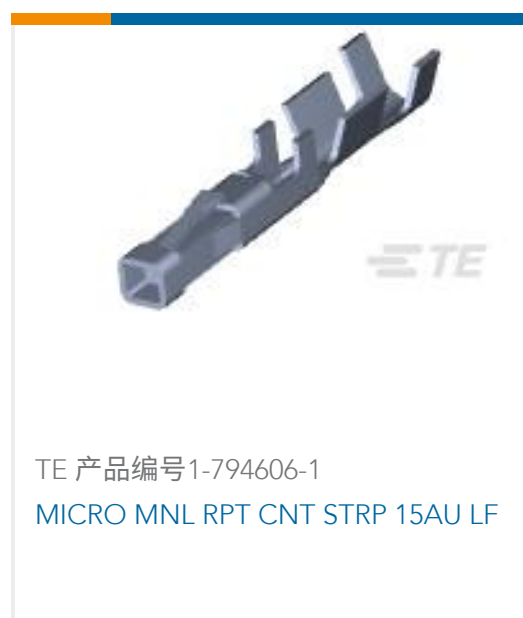
TE 产品编号1-794606-1 MICRO MNL RPT CNT STRP 15AU LF