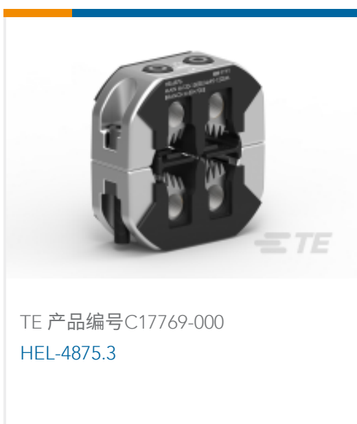
TE 产品编号C17769-000 HEL-4875.3