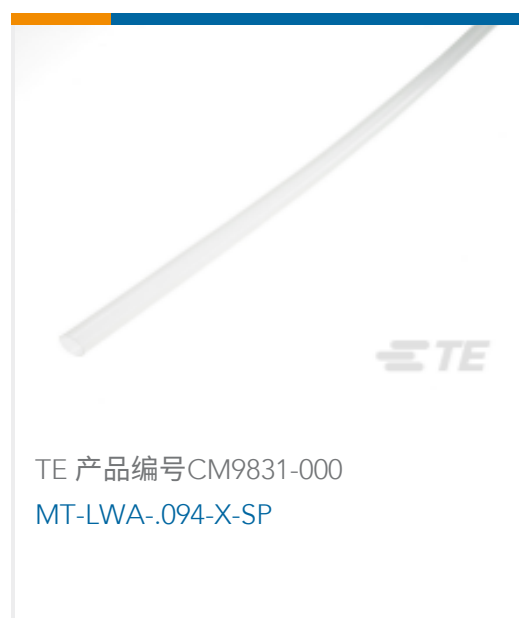
TE 产品编号CM9831-000 MT-LWA-.094-X-SP