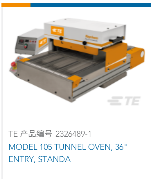
TE 产品编号 2326489-1 MODEL 105 TUNNEL OVEN, 36" ENTRY, STAND