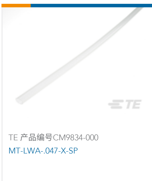
TE 产品编号CM9834-000 MT-LWA-.047-X-SP