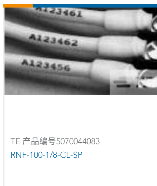
TE 产品编号5070044083 RNF-100-1/8-CL-SP