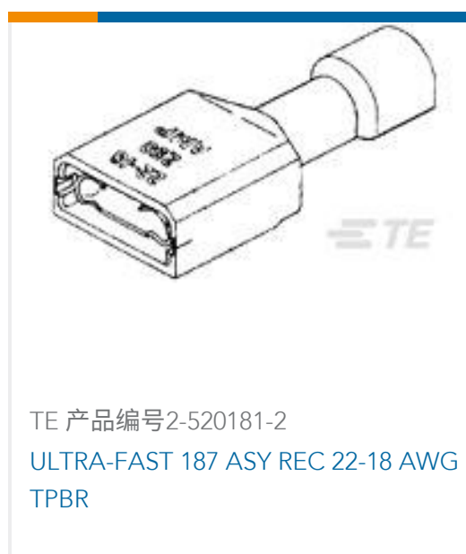
TE 产品编号2-520181-2 ULTRA-FAST 187 ASY REC 22-18 AWG TPBR