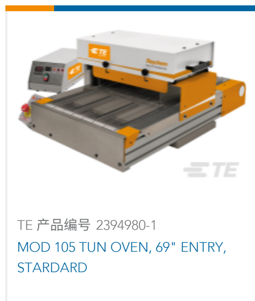
TE 产品编号 2394980-1 MOD 105 TUN OVEN, 69" ENTRY, STANDARD