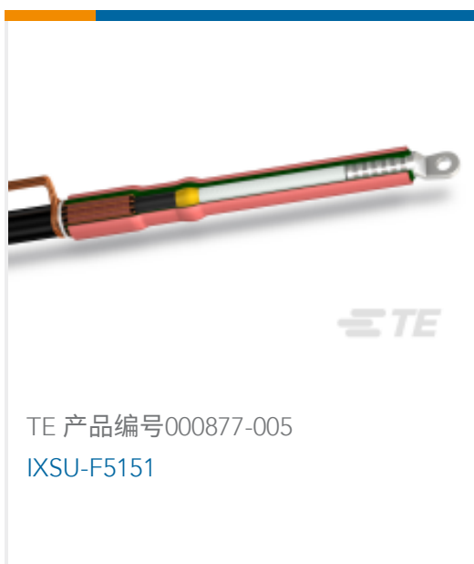
TE 产品编号000877-005 IXSU-F5151