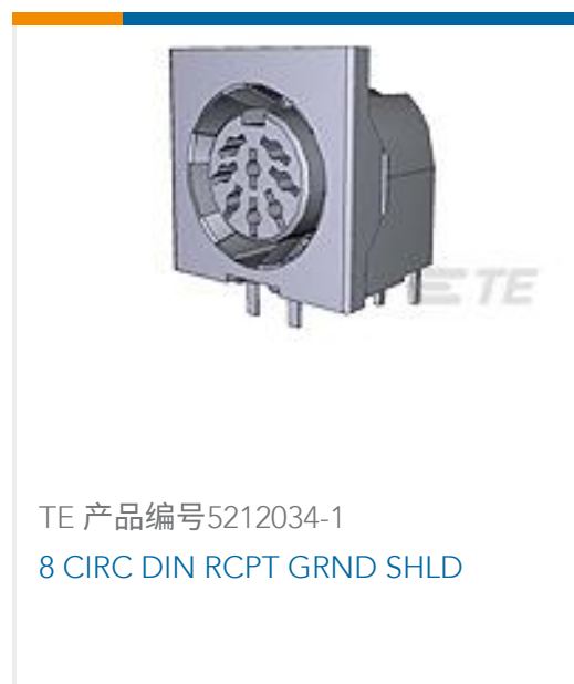
TE 产品编号5212034-1 8 CIRC DIN RCPT GRND SHLD