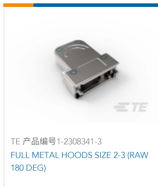
TE 产品编号1-2308341-3 FULL METAL HOODS SIZE 2-3 (RAW 180 DEG)