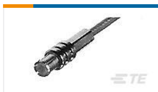
TE 产品编号1060875-2 MCX CABLE PLUG, CRIMP ATTACH