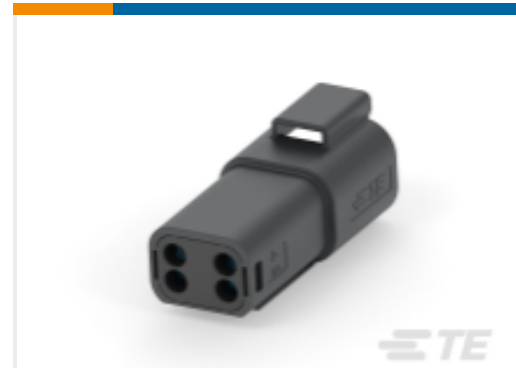
TE 产品编号1-2600030-0 4CCT BLACK RECEP W/LARGE SEAL