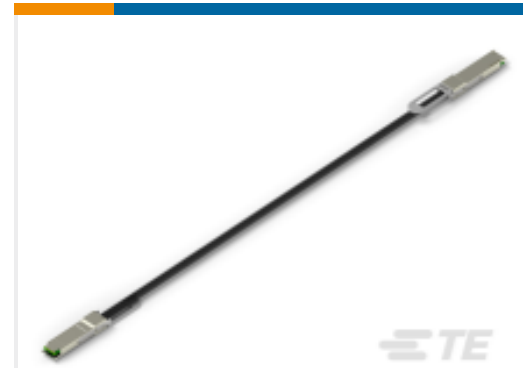
TE 产品编号2333393-7 QSFP 25GIG 30AWG 3 METER