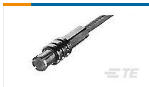
TE 产品编号1060875-2 MCX CABLE PLUG, CRIMP ATTACH