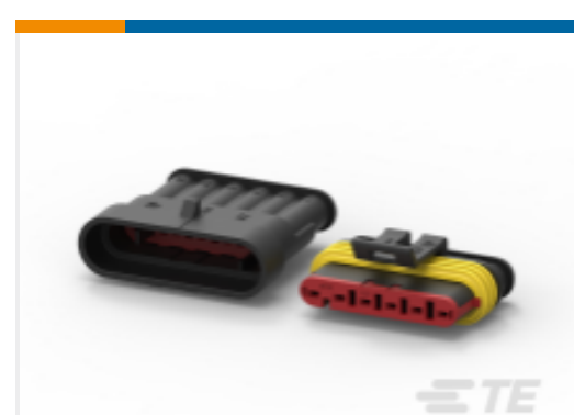
TE 产品编号282104-1 AMP SUPERSEAL 1.5MM, 连接器壳体