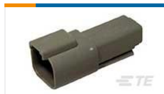
TE 产品编号DT04-2P REC, 2P, GRY, N